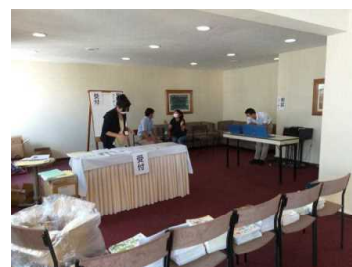
情報担当による PC 貸出