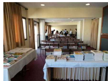
教育相談の場の設定