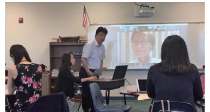
ダラス補習授業校でのオンラインを駆使した合同研究会

その夏、AG5の合同研修会がダラス補習授業校で行われることになっていました。そこにはプリンストン補習授業校の担当の三人の先生の中から一名が参加し、その成果も帰る予定になっていましたが、都合が悪くなり、他の二人の先生も予定が合わなかったため、委員の一人